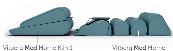
Vitberg Med Home Klin 1